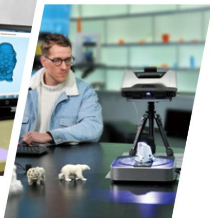
固定式全自动扫描

EinSCAN.Pro多功能手持式三维扫描仪有快速扫描和精细扫描两种扫描模式，适合不同尺寸大小和精细度要求的三维扫描测量。选配彩色纹理模块可实现对物体彩色纹理的扫描。主机采用人体工程学设计，重量仅0.8kg，操作容易、携带方便！