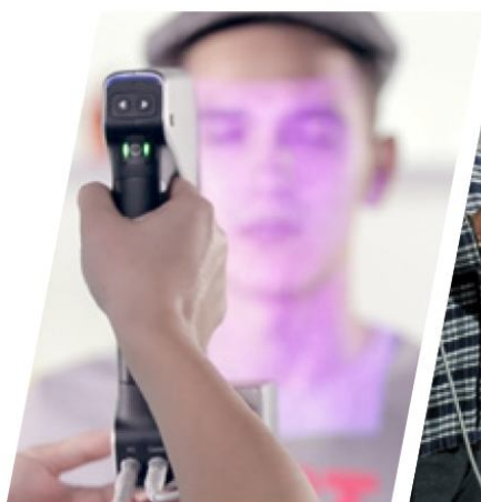
真彩色手持快速扫描